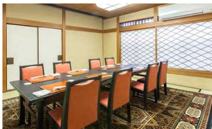
富士見 3F 2～10名様