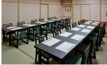
羽衣 3F 28名様まで

大広間となります。マイクなど音響設備もございますので、会議や発表会、宴会、ご婚礼などにもご利用いただけます。 真ん中で区切り、30名様ほどの部屋にもできます。