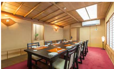
もみじ 3F 2～10名様