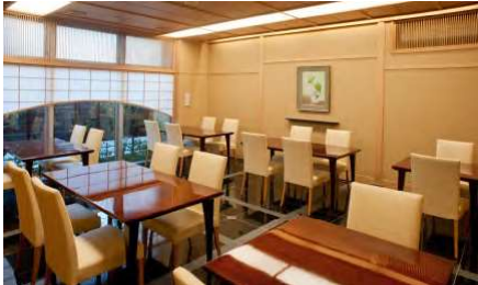
レストランテーブル席『蓬莱』(ほうらい) 1F

4人掛けテーブル4台と2人掛けテーブル2台、計20名様までのレストランです。単品料理や寿司の御注文はこちらでどうぞ。予約なしでご利用いただけます。