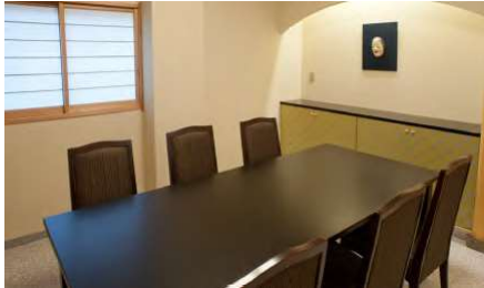
雅 1F 6名様まで

4人掛けテーブル4台と2人掛けテーブル2台、計20名様までのレストランです。単品料理や寿司の御注文はこちらでどうぞ。予約なしでご利用いただけます。