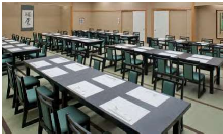
瑞雲 2F 80名様まで

大広間となります。マイクなど音響設備もございますので、会議や発表会、宴会、ご婚礼などにもご利用いただけます。 真ん中で区切り、30名様ほどの部屋にもできます。