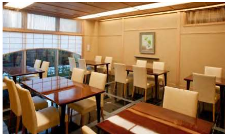
レストランテーブル席『蓬莱』(ほうらい) 1F

4人掛けテーブル4台と2人掛けテーブル2台、計20名様までのレストランです。単品料理や寿司の御注文はこちらでどうぞ。予約なしでご利用いただけます。