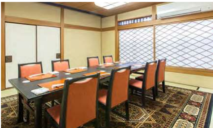
富士見 3F 2～10名様