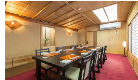
もみじ 3F 2～10名様