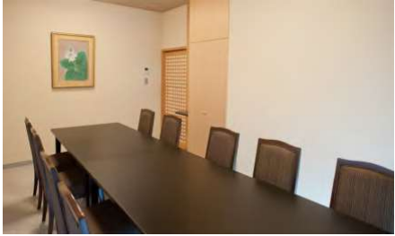
葵 1F 10名様まで