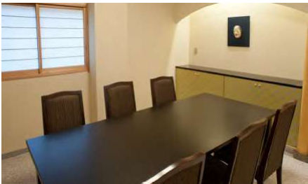
雅 1F 6名様まで

4人掛けテーブル4台と2人掛けテーブル2台、計20名様までのレストランです。単品料理や寿司の御注文はこちらでどうぞ。予約なしでご利用いただけます。