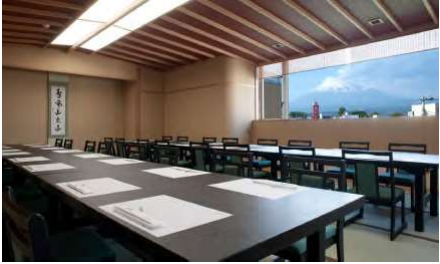
富士 3F 36名様まで

優美で落ち着いた部屋で、ゆっくりくつろぎながらお食事が楽しめる造りになっています。 法事や家族会にピッタリです。