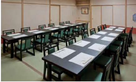
羽衣 3F 28名様まで

大広間となります。マイクなど音響設備もございますので、会議や発表会、宴会、ご婚礼などにもご利用いただけます。 真ん中で区切り、30名様ほどの部屋にもできます。